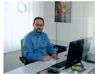
Neuerdings trennt eine Plexiglasscheibe die beiden Arbeitsplätze im Sekretariat.